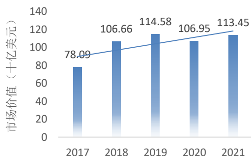
表 1 2017-2020 年泰国电子商务贸易额, 以及 2021 年的预测 (单位: 十亿美元) 来源: Statista

如下表 1 所示, 泰国的在线贸易总额预测在 2021 年达到 1134.5 亿美元, 与 2017 年相比增长 45.3%。 2 在东南亚区域, 泰国占据了企业对消费者电子商务 (B2C) 领域市值之首, 其 2021 年的市值预计超过 277 亿美元。 3